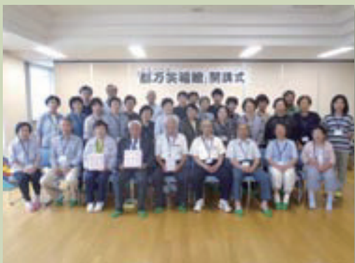
平成23年度「都万笑福館」開講式に参加された皆さん(都万保健センター)