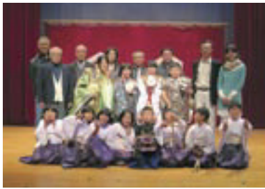
ゲスト出演した雲南市の深野神楽子ども教室の子どもたちと指導者の皆さん。「清目」と「大蛇退治」の2演目を披露しました。