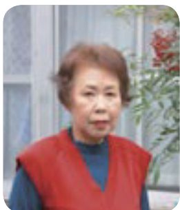
農林水産表彰を受章