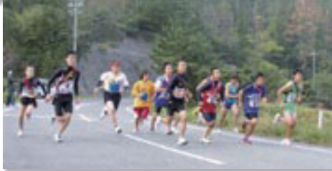
写真下：ホテル海音里前(福浦地区)をスタートする中学男子、一般男子の選手皆さん