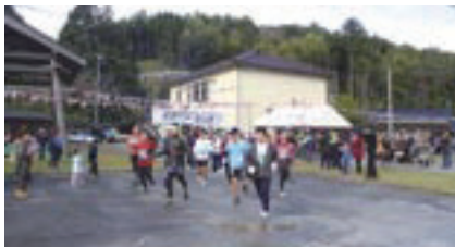
有木集会所をスタートする参加者の皆さんと声援を送る有木地区等の皆さん。

島外からの参加者14名を含む、総勢30名のランナーが、急勾配の山道をマイペースで走りました。