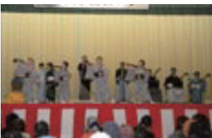
新民謡「布施の里節」を披露する隠岐民謡同好会の皆さん

浄土ヶ浦まつりが、布施町民体育館及び布施公民館で開催されました。会場では、オープニングに日の丸保育所園児の皆さんによるマルモリダンスが披露された後、布施の海産物、加工品等の販売の他、布施の新しい民謡「布施の里節」も披露され、会場は大勢の来場者で賑わいました。