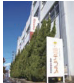
◀ 法テラスが開設 (1月7日) 司法過疎地での法的サービス支援を目的として、港町に「法テラス西郷法律事務所」が開設。弁護士1名が常駐し法律相談を行う体制が整備されました。