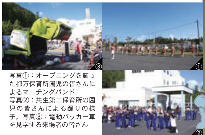
写真①：オープニングを飾った都万保育所園児の皆さんによるマーチングバンド 写真②：共生第二保育所の園児の皆さんによる踊りの様子。写真③：電動パッカー車を見学する来場者の皆さん