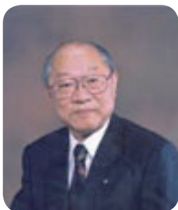
地方自治表彰を受章