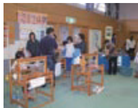
「さをり織り」を体験する来場者の皆さん

会場には、児童生徒の皆さんが作った野菜や工芸品等の即売や織物等の体験コーナーなどが設けられました。また、同校と隠岐高校吹奏楽部による合同演奏会もあり来場者の皆さんは楽しい演奏に聞き入っていました。