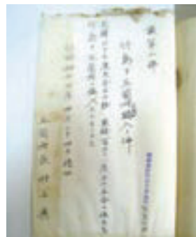
◀ 竹島関連の新資料発見 (2月23日) 本町と島根県が共同で取り組んでいる竹島に関する資料調査で、昭和14年に旧五箇村が竹島の編入を承認したことを示す「竹島編入議決書」が新たに確認されました。