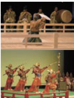
隠岐国分寺蓮華会舞の麦焼き之舞(写真上)と天理大学雅楽部による太平楽(写真下)の様子

公演は、「第一部」隠岐国分寺蓮華会舞保存会による七演目、「第二部」天理大学雅楽部による二演目があり、隠岐国分寺蓮華会舞の発祥の地での公演と、その起源ともいわれる「雅楽」との共演は歴史的意義が有り、「伝え受け継ぐ想い」を感じていただく機会となりました。