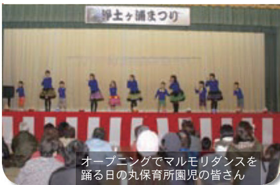
オープニングでマルモリダンスを踊る日の丸保育所園児の皆さん