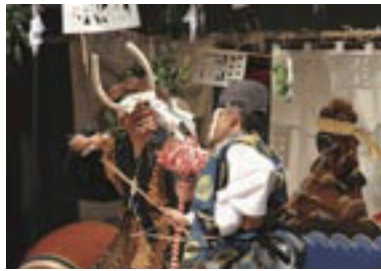
今津神楽保存会と東郷高倉会の皆さんによる「随神」の様子。 ※随神：随神が、鬼の姿で現れる邪心を弓で射て退散させるという内容。