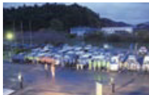
出発式に参加していただいた住民ボランティアの皆さん

年末の犯罪や事故防止に向けての歳末特別警戒発式が役場本庁前で行われました。会場には、隠岐の島警察署員や各地区の「見守り隊」など約50名の住民ボランティアの皆さんが集合し、出発報告を行なった後、パトカーや青色パトロールカー等、それぞれ車両で各担当地域に向けてパトロールに向かいました。歳末特別警戒は、12月31日まで実施されます。