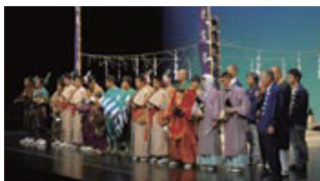
第1部の公演後、舞台挨拶をする隠岐国分寺蓮華会舞保存会の皆さん

また、同会場において「隠岐の島町特産品の販売」を行なったところ、売り切れた商品もでるなど大盛況に終わりました。