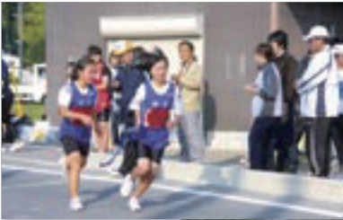
写真上：中学女子4区から5区のタスキ渡し(有木地区)

46秒の新記録で優勝したほか、中学女子の部、中学混成の部で4つの区間新記録が出ました。