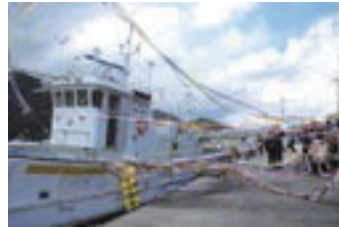
出港する漁船に紙テープをはって見送る関係者の皆さん

育所園児の皆さんによる元気な和太鼓の演奏も行われ、カニ漁のスタートを祝いました。