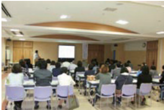
「サポーター養成講座」の様子(役場ふれあいセンター)