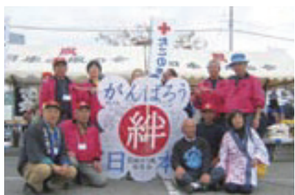
大会に参加した隠岐いぐり風保存会の皆さん

10月29日(土)～30日(日)、東京中央区(晴海埠頭)において、日本の風の会秋季大会が開催され、本町から参加した「いぐり風保存会」の皆さんを含め、約320名の参加者が自慢の風を揚げ競いました。