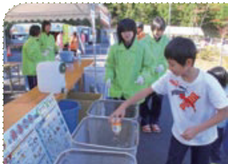
会場には、エコステーションが設置され、隠岐高校の生徒の皆さんが会場で出たゴミの分別方法を来場者の皆さんに説明しました。

（この5Rフェスタは全国モーターポート競走施行者協議会からの拠出金を受けて実施されました。）