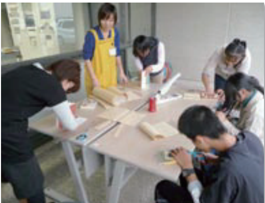
当日行われた「ブックコート体験」の様子

11月に行われた図書館まつりでは、たくさんの方々に足を運んでいただいたおかげで、おはなし隊訪問やブックコート体験、古本市などのイベントも盛り上がり、楽しい2日間となりました。皆様本当にありがとうございました。