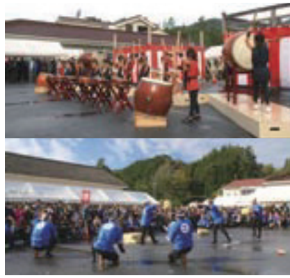
会場を盛り上げたごが保育園園児の皆さんによる和太鼓の演奏（写真上）と苗代田地区の皆さんによる余興（写真下）の様子

オープニングでは、ごが保育園園児の皆さんによる和太鼓が披露された後、苗代田地区の皆さんによる余興や米10斗分の餅まきが行われました。