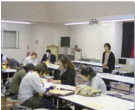
西郷小学校で開催された「親学プログラム」の様子